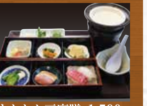
あたたか豆腐膳 1,590円