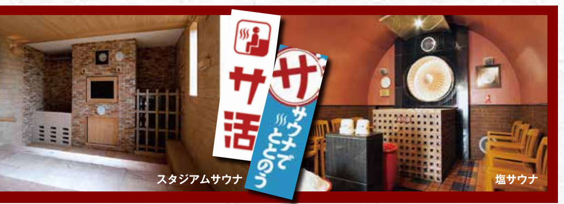
スタジアムサウナ