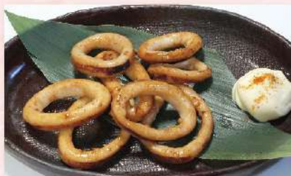
スルメイカの バター醤油焼き 590円