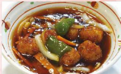
手作り肉団子 黒酢炒め 750円