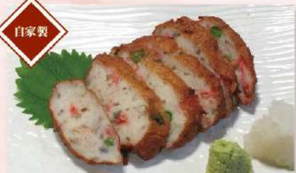
自家製さつま揚げ 590円