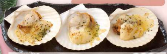
殻付きホタテのマヨネーズソース焼き 680円