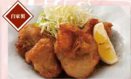
自家製鶏から揚げ 590円