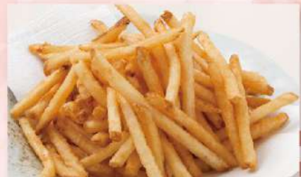
さくっと メガクランチポテト 420円