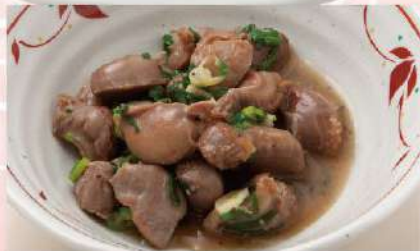
砂肝 ねぎ塩炒め 490円