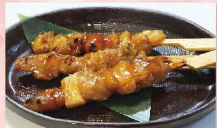
焼き鳥盛り合わせ 480円