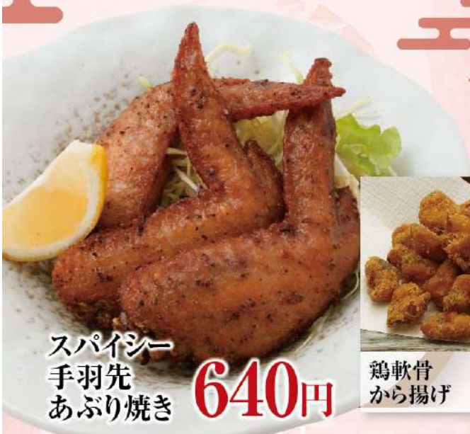
スパイシー 手羽先 あぶり焼き 640円