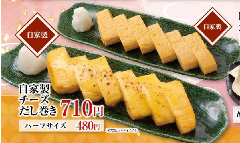
自家製 チーズ だし巻き 710円 ハーフサイズ 480円