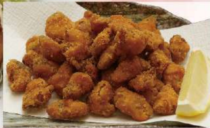
鶏軟骨 から揚げ 580円