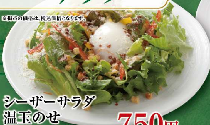
シーザーサラダ 温玉のせ クリーミーソース 750円