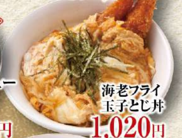
海老フライ玉子とじ丼 1,020円