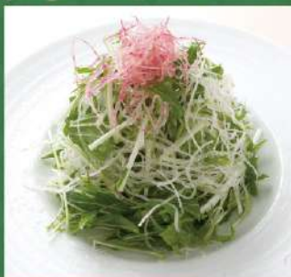
有機野菜と千切り大根 シャキシャキ柚子サラダ 580円