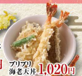
プリプリ海老天丼 1,020円