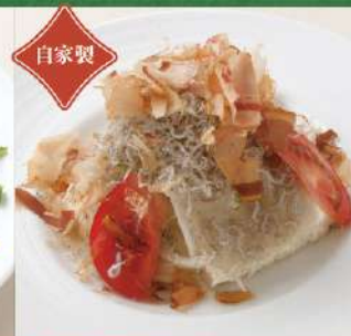
自家製豆腐とじゃこのヘルシーサラダ 800円