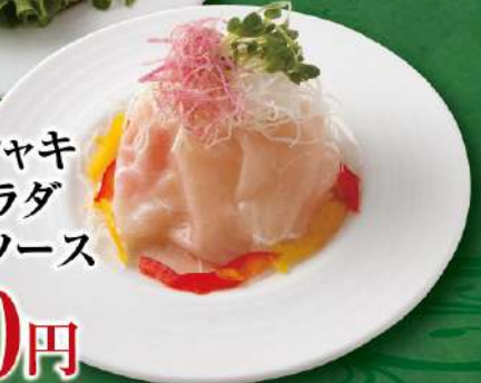
生ハム シャキシャキ 大根サラダ バジルソース 780円