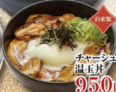
自家製 チャーシュー温玉丼 950円