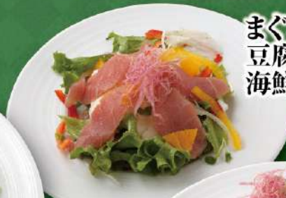
まぐろと豆腐のサラダ 海鮮わさびソース 990円