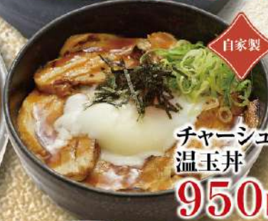
自家製 チャーシュー温玉丼 950円