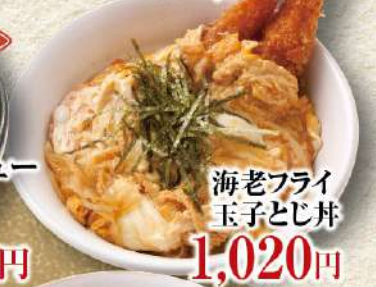
海老フライ玉子とじ丼 1,020円