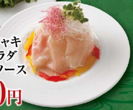
生ハム シャキシャキ 大根サラダ バジルソース 780円