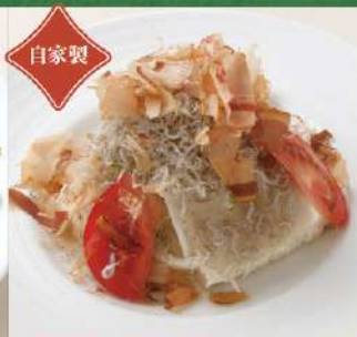
自家製豆腐とじゃこの ヘルシーサラダ 800円