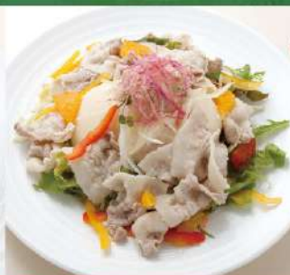
豚しゃぶ豆腐のサラダ ポン酢ジュレ 920円